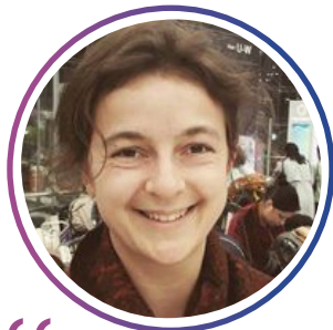
Lore, 26 online simulatie 2020