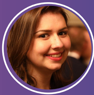
Aïda, 23 simulatie '20

Wij blijven jongeren ondersteunen; ook nu moet de stem van de jeugd gehoord worden en dit meer dan ooit omdat deze generatie de toekomst na corona zal vormgeven .