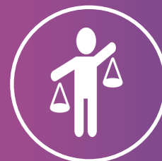
Lid Raad van State

In een democratie kan het niet ontbreken aan een sterke vierde macht, de pers, die functioneert als waakhond. Ook binnen het Vlaams Jeugd Parlement spelen journalisten daarom een belangrijke rol. Naast de volksvertegenwoordigers, participeert er jaarlijks ook een equipe journalisten aan de simulatie. Gewapend met camera en micro legt deze creatieve bende de volksvertegenwoordigers het vuur aan de schenen, brengt ze verslag uit van de belangrijkste gebeurtenissen tijdens de simulatie en gaat ze op locatie om reportages te draaien. Het verzamelde materiaal verwerken de journalisten in een aantal boeiende journalistieke items. Een voorsmaakje van eerder gemaakt werk vindt u op de Facebook-pagina van het Vlaams Jeugd Parlement.